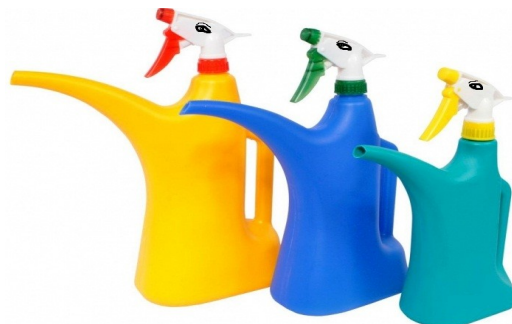
Ахтунг! Партия распыляторов на марше!

(Примечание редакции: Насчёт злодеев — это, разумеется была шутка)